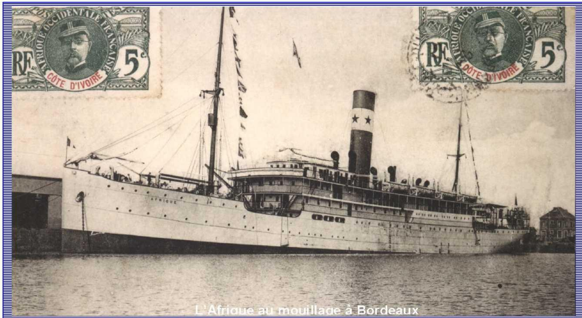
L'Afrique au mouillage à Bordeaux