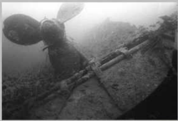
L'hélice bâbord et le safran