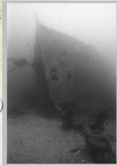
L'ancre bâbord posée sur le sable