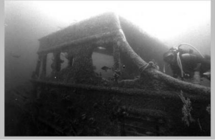
Passerelle vue de tribord