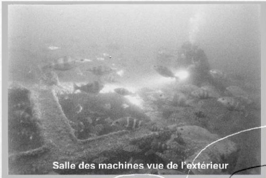
Salle des machines vue de l'extérieur